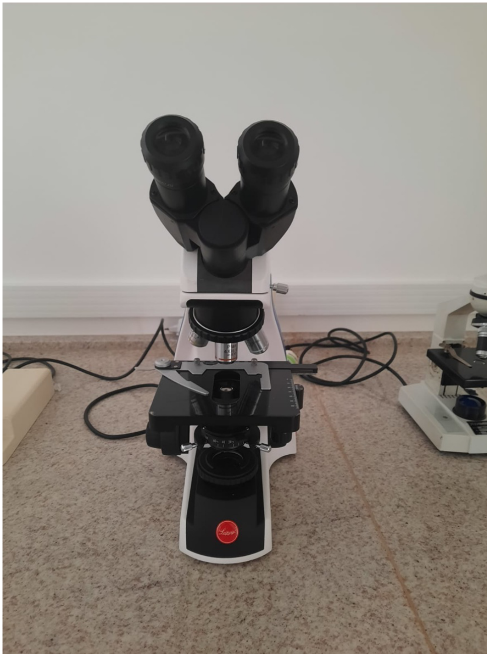
Foto do bem: Lupa Estereomicroscópica. Equipamento entregue e em uso.

Situação atual item 3 – Refrigerador: processo de compra realizado, item entregue pelo fornecedor e recebido pelo gestor do TED pela Embrapa Pesca e Aquicultura (Vide OCS: 6437290, arquivo anexo)