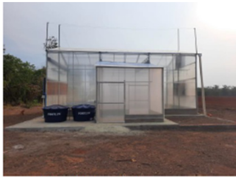
A – vista frontal de entrada