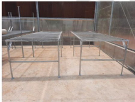
E- Bancadas de telas em aço inox