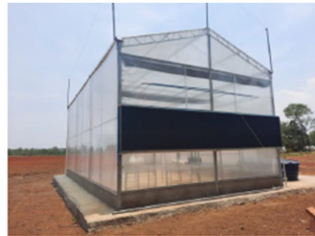
B – Vista do fundo (colmeia de circulação de umidade-faixa escura) e parede lateral,