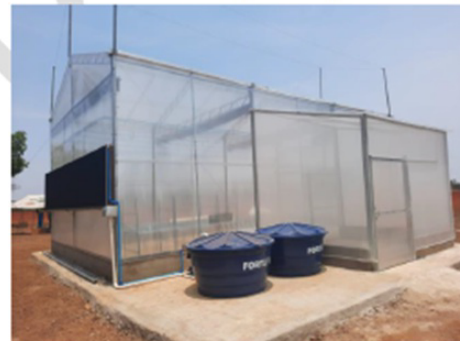
F – Caixas d'água do sistema de irrigação e circulação de umidade

Fotos (A, B, C, D, E e F) da casa de vegetação instalada no Campo Experimental de Sistemas Agrícolas da Embrapa Pesca e Aquicultura em Palmas-TO.