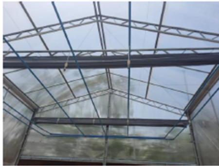
C – Vista interna sistema de irrigação