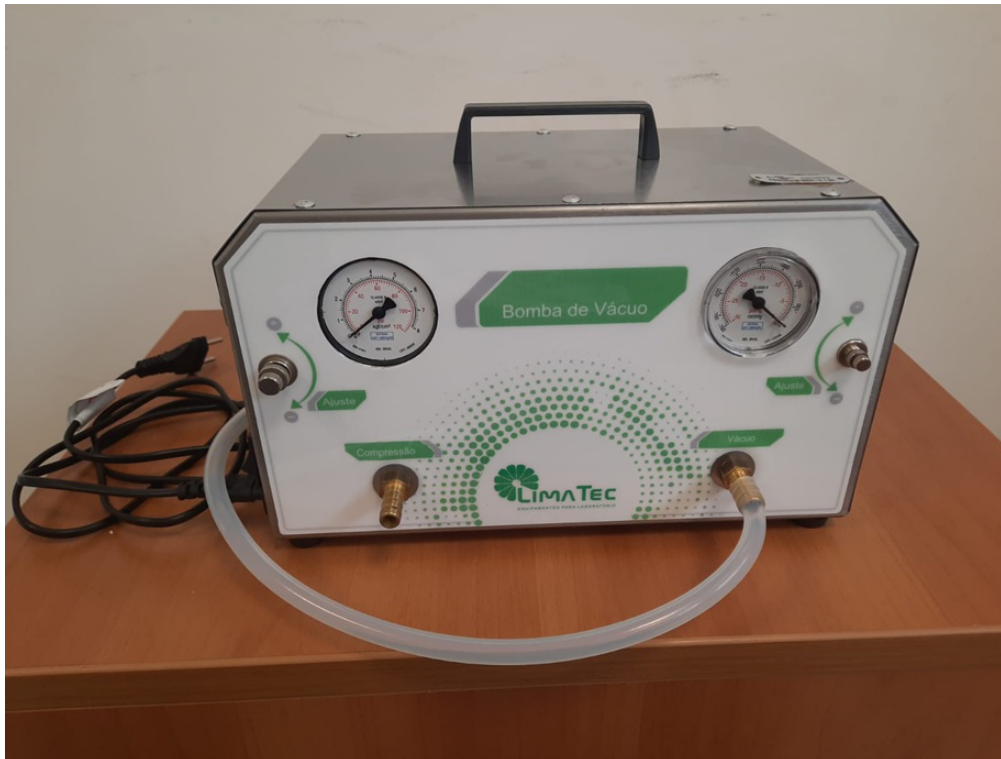
Foto do bem: Bomba de vácuo com compressor de ar. Equipamento entregue e em uso.

Amparo Legal: Art. 29, Inc. II, da Lei n.º 13.303/2016